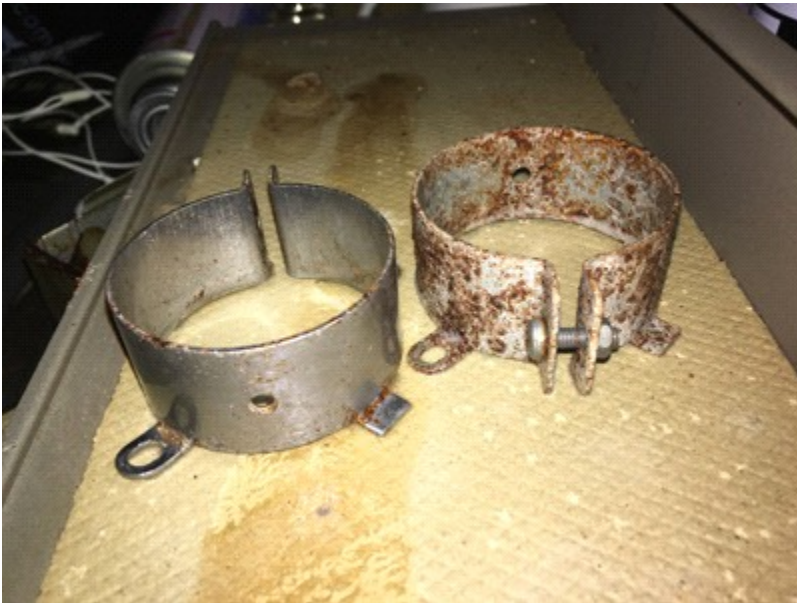
交換コンデンサーの大きさ