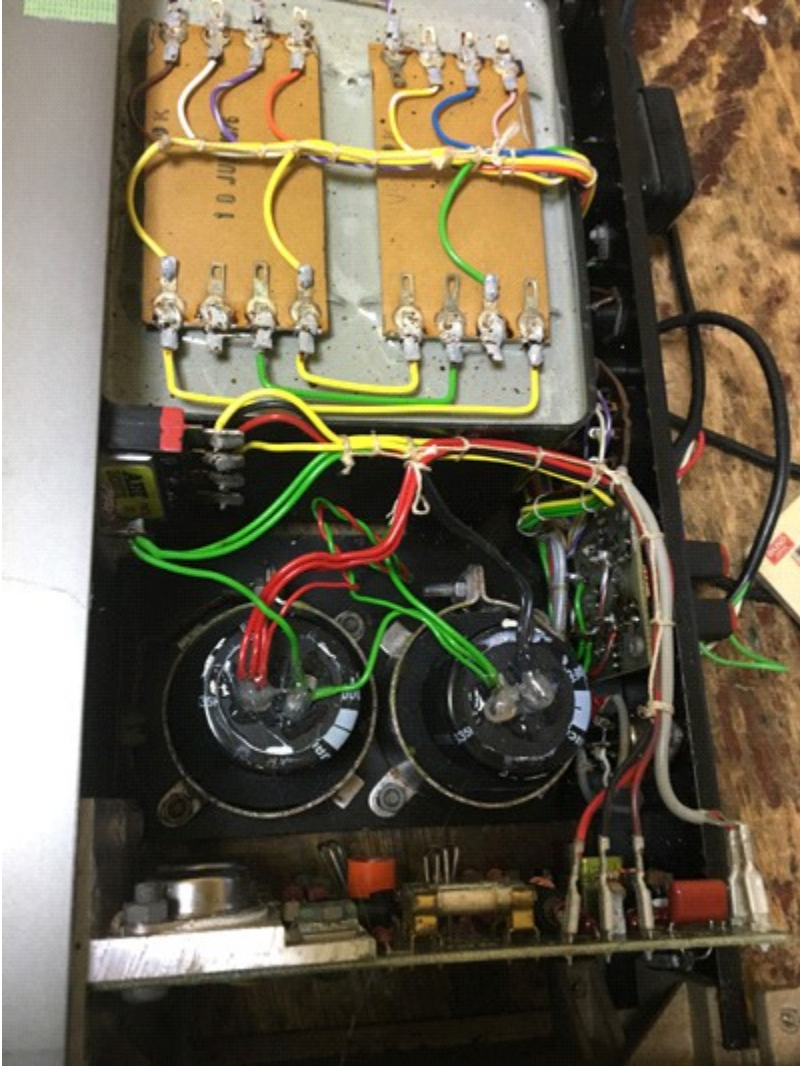
下側基盤の右下フィルム+電解コンデンサーに交換(両CH) 1UF+0.01UF